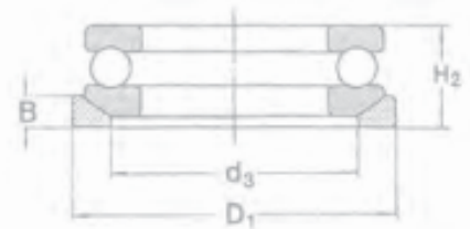
avec rondelle logement sphérique + contreplaqué