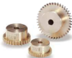
Bronze - BSS