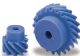
Denture 45° - Nylatron PN