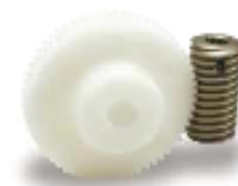
Roue/Vis Acétal – SUW