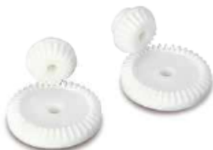
Acétal Injecté – DB