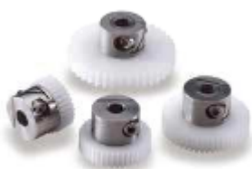
Nylon/Acier - DSL