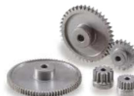
Acier Fritté – LS